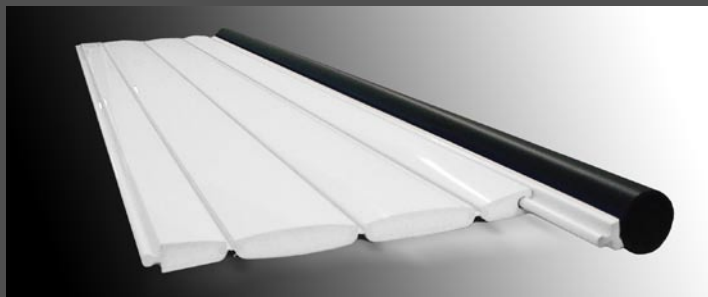
Cleveres Bugrohr: wird die Wickelvorrichtung unter Wasser montiert, verschliesst sie die baubedingte Spalte. Sicherheit pur!